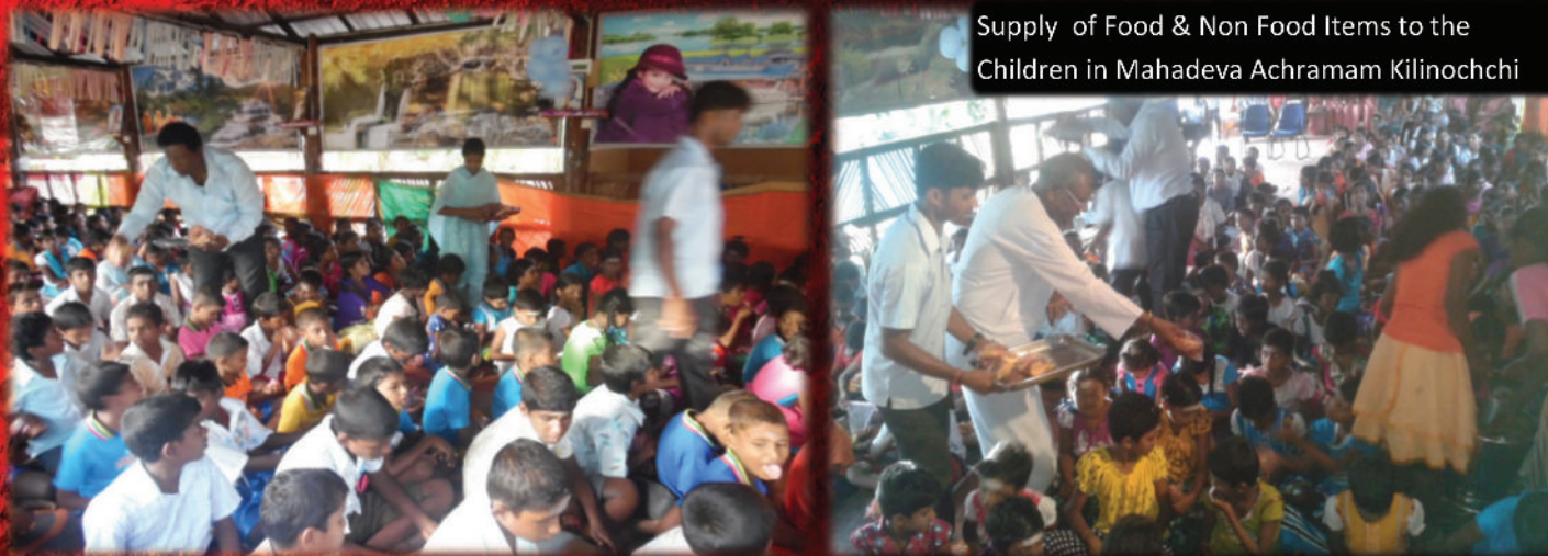
Supply of Food & Non Food Items to the Children in Mahadeva Achramam Kilinochchi