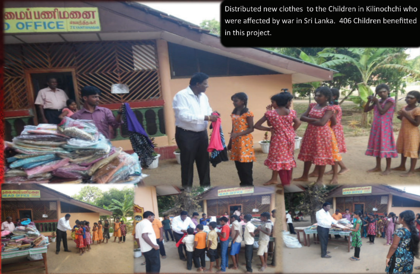
Distributed new clothes to the Children in Kilinochchi who were affected by war in Sri Lanka. 406 Children benefitted in this project.