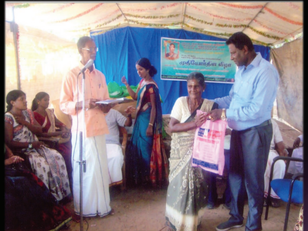
Annai Sivahamy Foundation - Charity works in Sri Lanka and UK