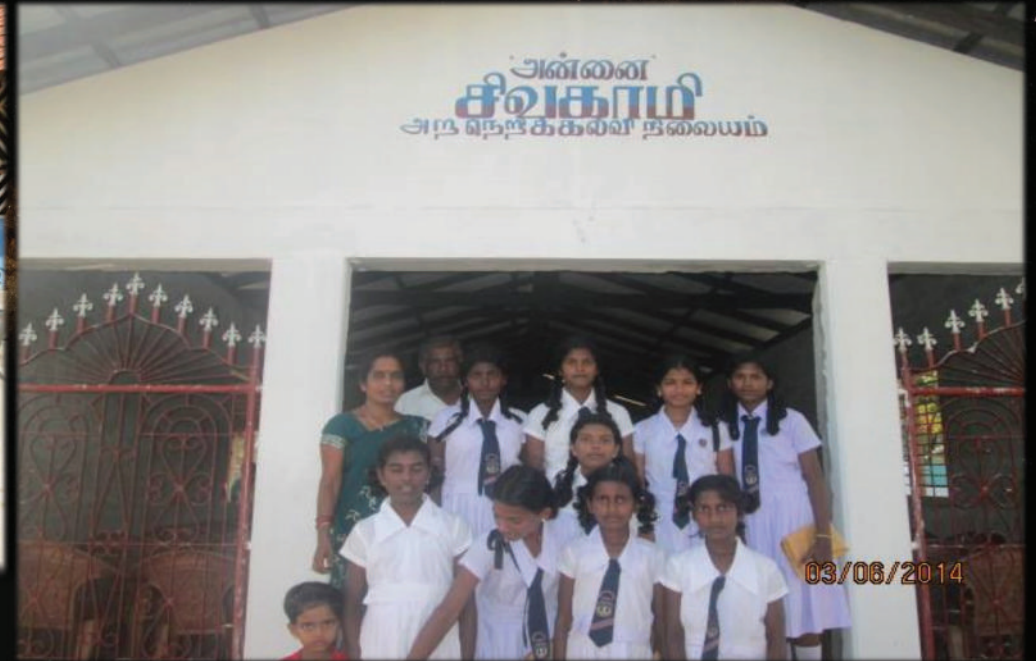
Established Free Education Centre for war affected children in Kovilvayal, Iyakachchi, Sri Lanka