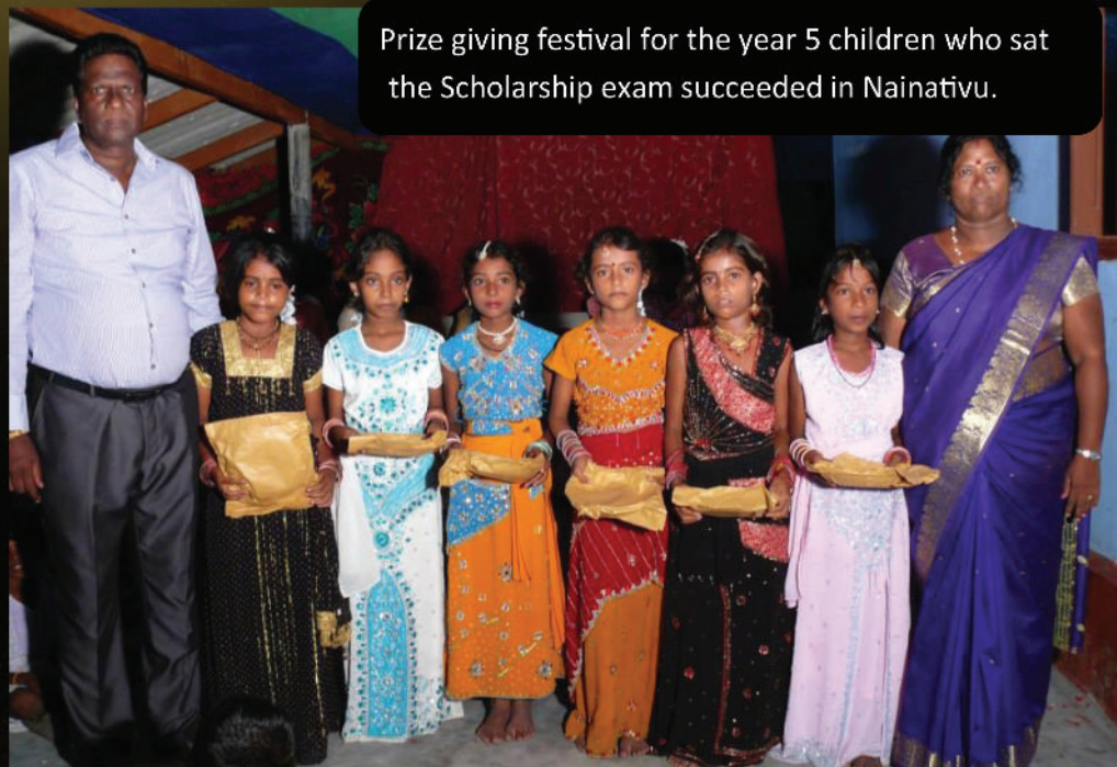
Prize giving festival for the year 5 children who sat the Scholarship exam succeeded in Nainativu.