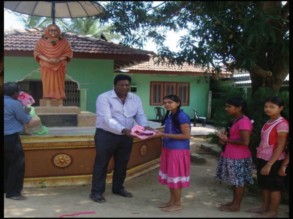
For Shirdi Sai Temple's second anniversary, we provided meal to five children and elders homes in Sri Lanka.