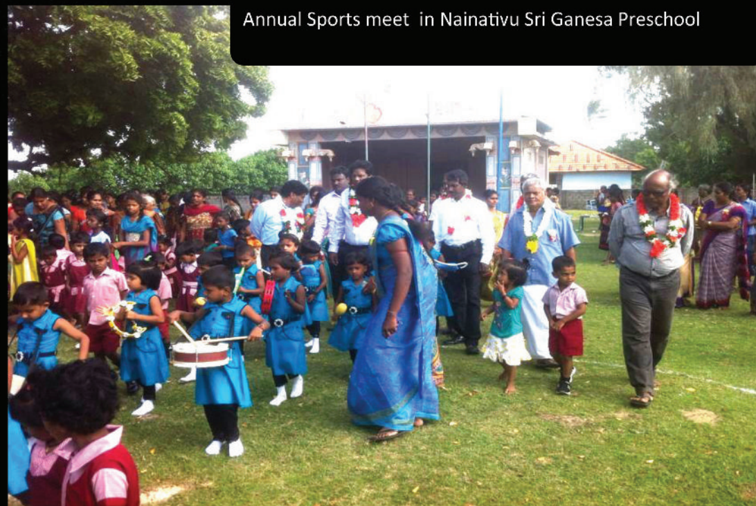
Annual Sports meet in Nainativu Sri Ganesa Preschool