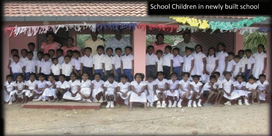
School Children in newly built school