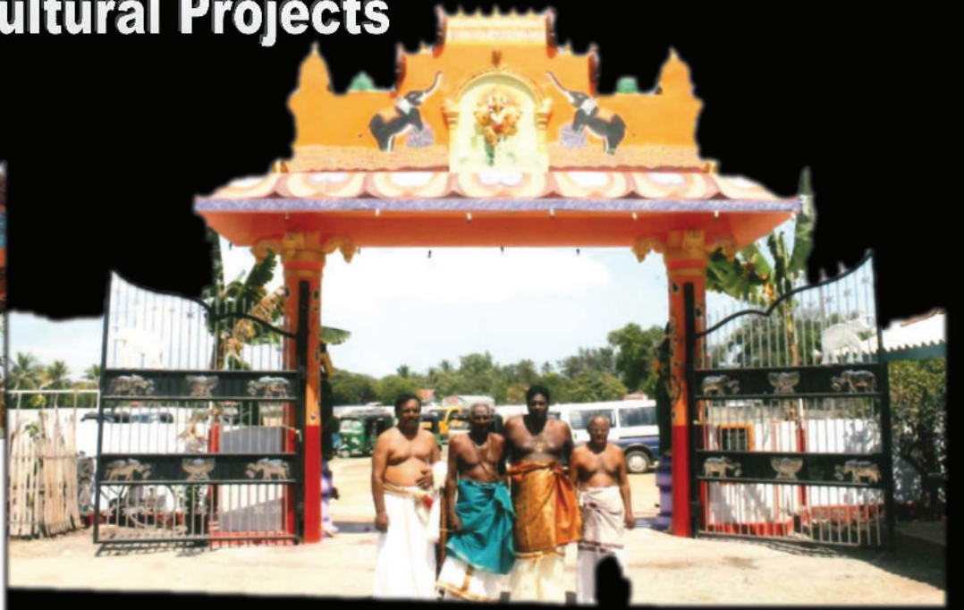
Newly built rear temple entrance in Nainai Semmanatham Pulam Sri Veerakathi Vinaayakar Temple and Aiyappan Temple sponsored by Annai Sivahamy Foundation