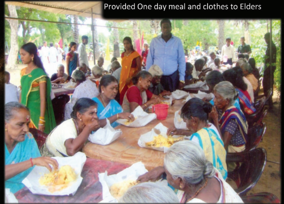
Provided One day meal and clothes to Elders