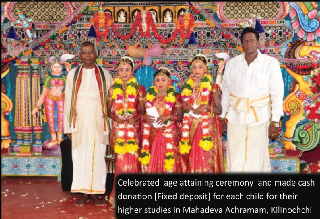
Celebrated age attaining ceremony and made cash donation [Fixed deposit] for each child for their higher studies in Mahadeva Achramam, Kilinochchi Sri Lanka.