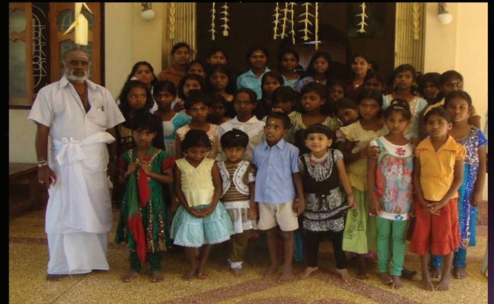
Shirdi Sai Temple - Charity works in Sri Lanka and UK