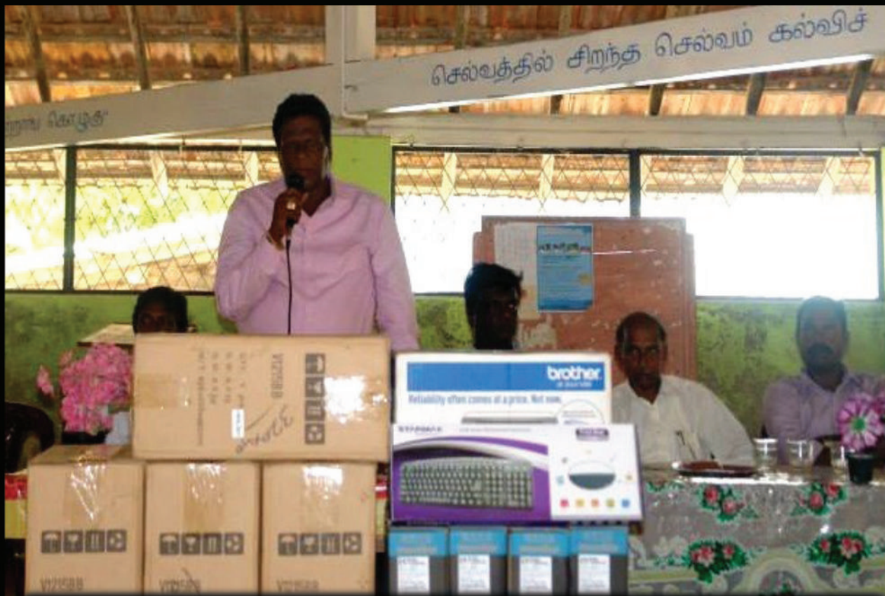
Donated Computer, printer and other accessories to the Nainativu Nagapooshani Maha Vidyalayam on 12th March 2015.