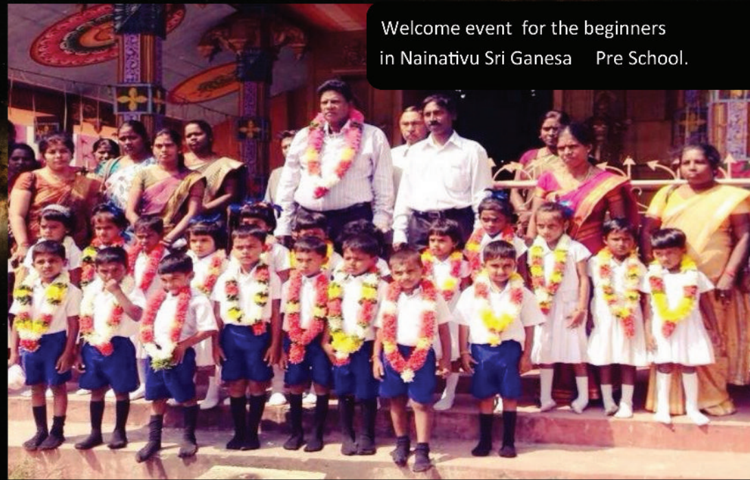
Welcome event for the beginners in Nainativu Sri Ganesa Pre School.