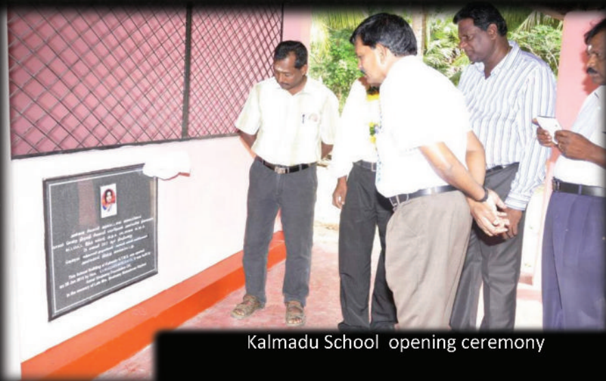
Kalmadu School opening ceremony