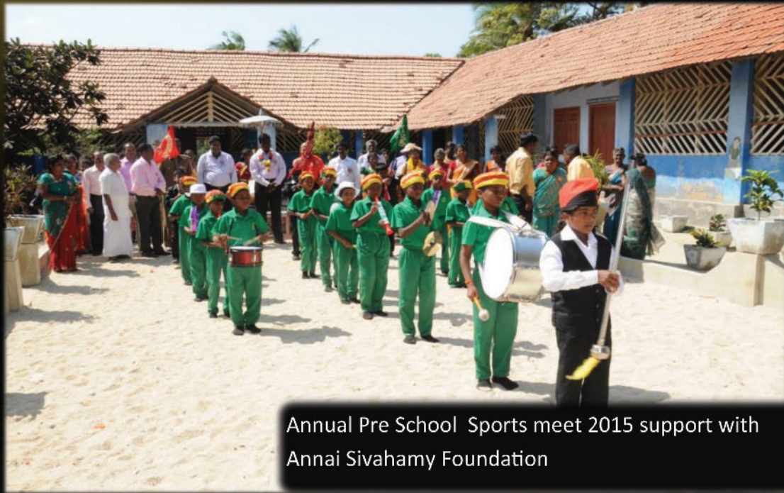
Annual Pre School Sports meet 2015 support with Annai Sivahamy Foundation