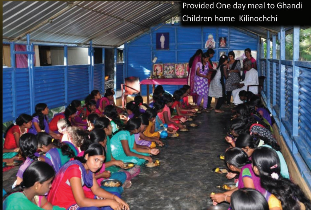
Provided One day meal to Ghandi Children home Kilinochchi