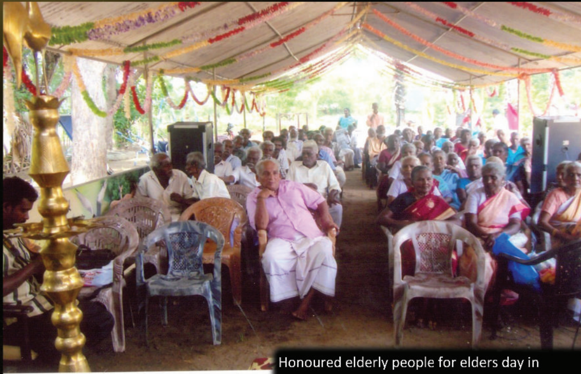
Honoured elderly people for elders day in Uruthirapuram Kilinochchi, Sri Lanka