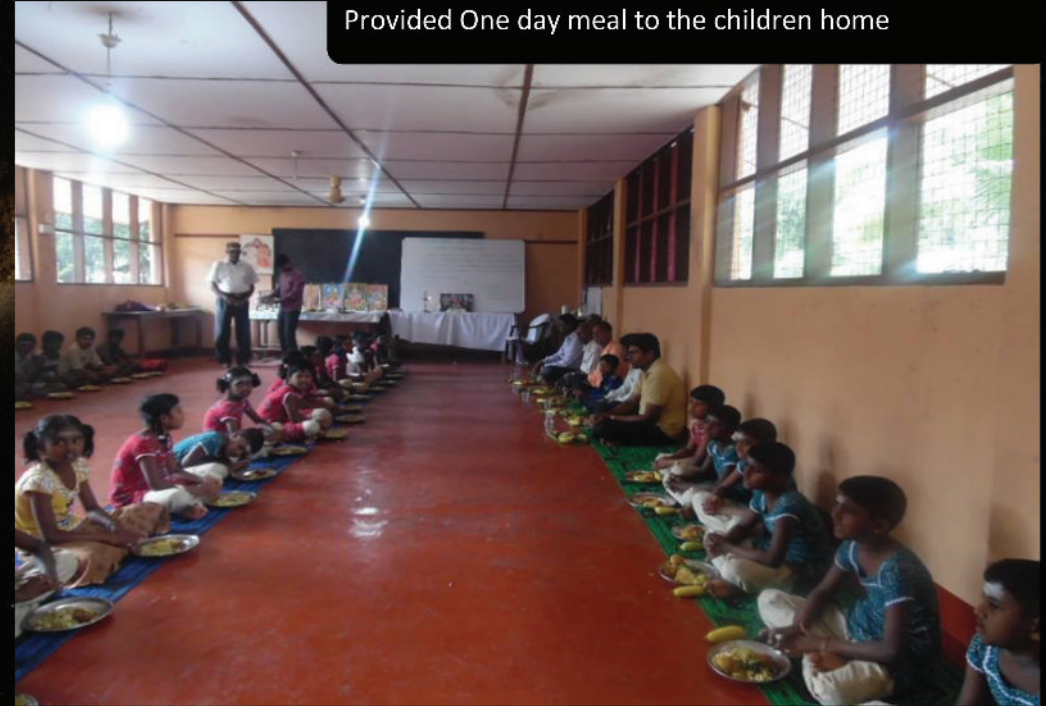
Provided One day meal to the children home