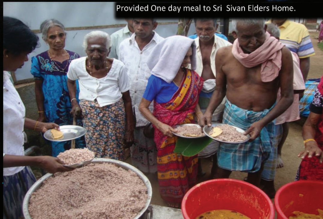
Provided One day meal to Sri Sivan Elders Home.