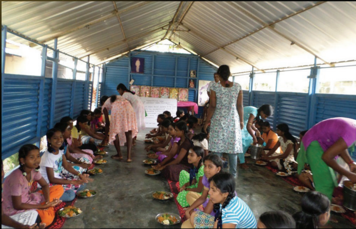
Provided One day meal to the children homes in Kilinochchi, Sri Lanka